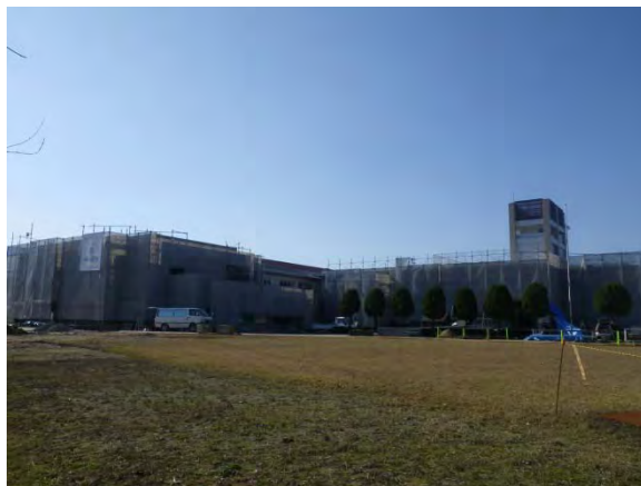
(グラウンドから見た全景)

工事は増築部のコンクリートも固まり、仕上げ工事へと進みます。改修部は先月に引き続き、内外装の仕上げ作業を行っています。