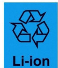
Li-ion リチウムイオン電池