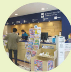
容器は生協の受付へ