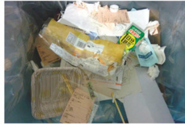
燃えるごみ、プラスチック製容器包装、ペットボトルのキャップ、コテバックが混在している