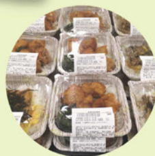
コテバックのお弁当