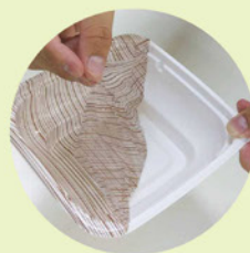
食べ終わったら、 汚れたフィルムをはがして捨てる