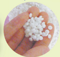
再生センターでペレットに 加工され、再び製品になる

リサイクル容器(コテバック)とポイントカードを持って生協の受付に行くと、1個につき1つスタンプを受け取ることができます。スタンプを10個ためると110円分のficチャージ券として利用できます。コテバック回収率が年々下がっていますので、ぜひご協力ください!